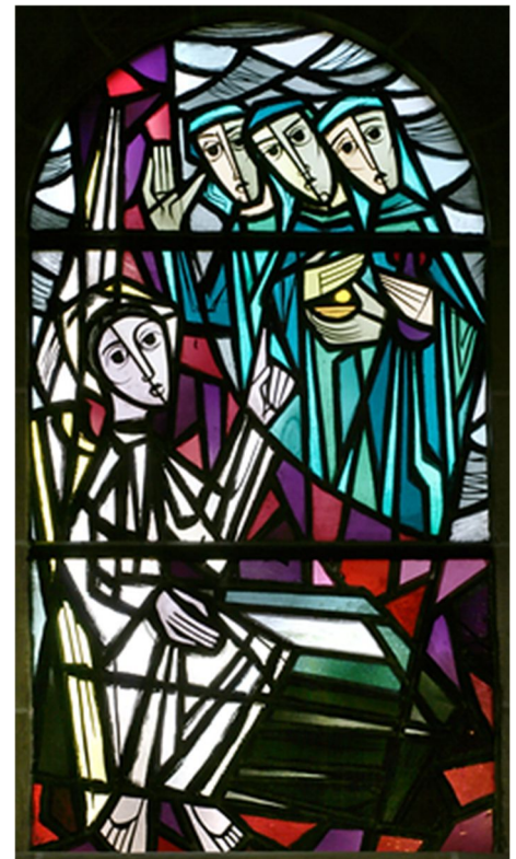
Drei Frauen am Grab (Jupp Gesing, 1965) Fenster unserer Herz-Jesu-Kirche

Hätte man dieses Ereignis erfinden wollen, hätte man alles machen dürfen, nur nicht eben Frauen, die in der Antike, leider Gottes, nichts galten, in so eine entscheidende Position zu bringen. Das leere Grab setzt das volle Grab voraus. Das ist der eigentliche Skandal: dass der Messias wirklich gestorben ist. Der Blick darf aber nicht am Grab kleben bleiben.